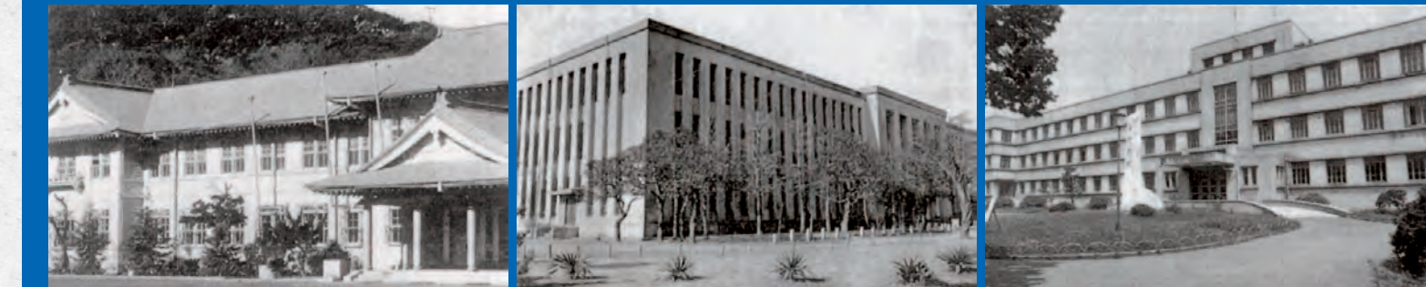
旧文学部校舎（鎌倉） 旧経済学部校舎（清水ヶ丘） 旧工学部校舎（弘明寺） 学生歌「みはるかす」は 60 年という時を経てなお、その響きが遠く遥かなものを見せている歌、心に残る歌として広く歌い継がれています。

おかえりなさい。ようこそ「みはるかす」の丘へ 時代を、学部を超えて。横国 Day でツナガル。